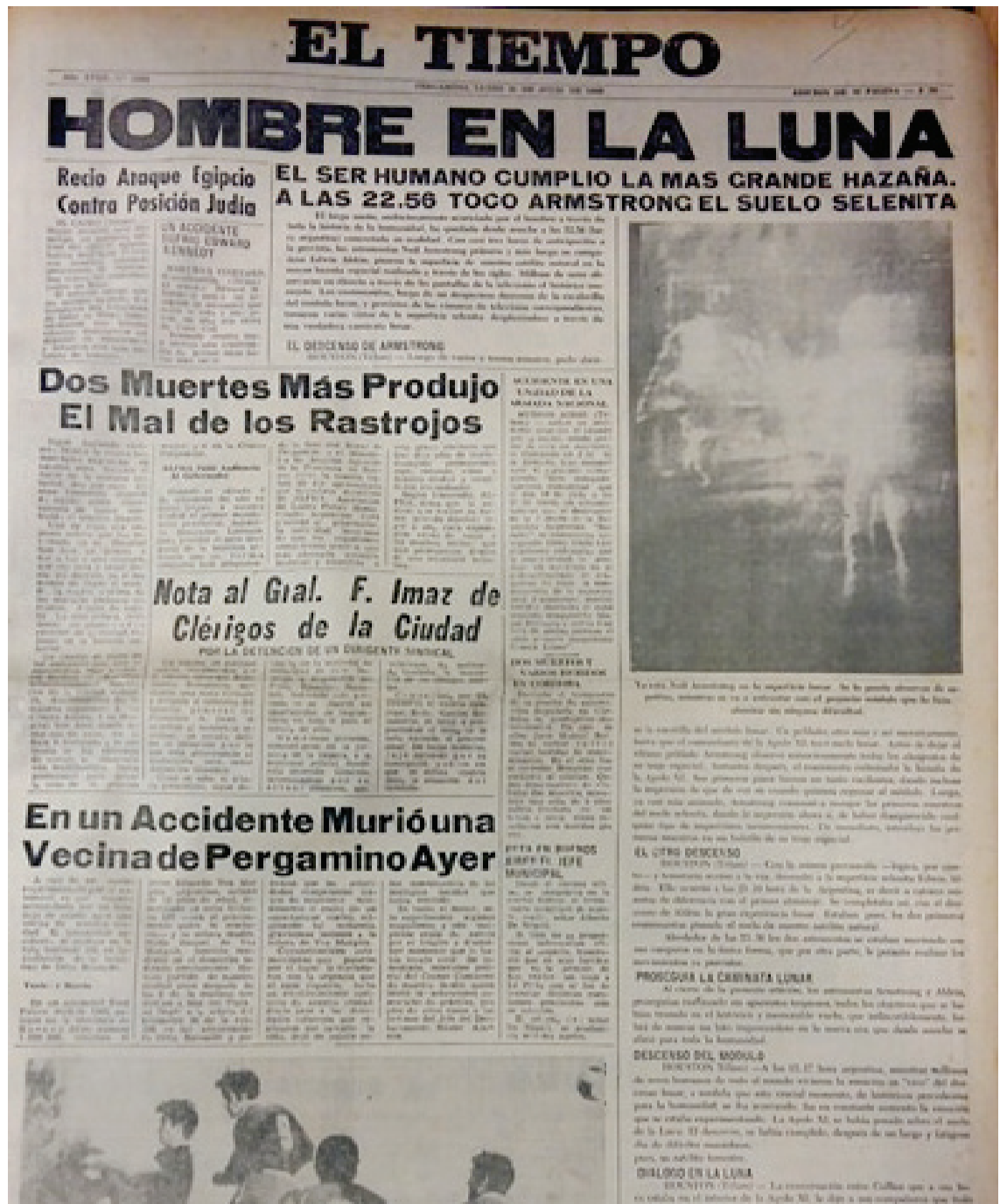
Tapa de EL TIEMPO 1969

1967.- El Tiempo recibe una distinción de su colega El Debate de Zárate que consiste en una medalla de oro y un diploma.